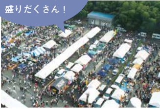
うしくWaiワイまつり(11月)