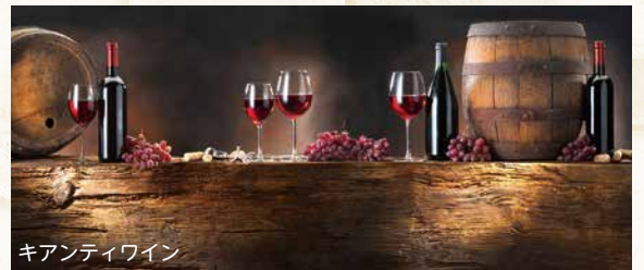
キアンティワイン