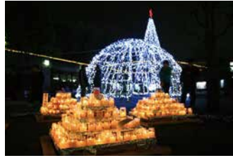
ブリアントヴィルうしく(12～1月)