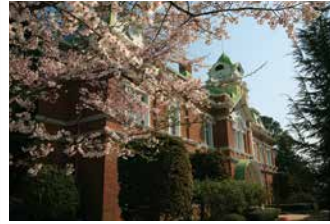
牛久シャトー桜まつり(3月下旬～4月初旬)